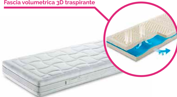
Fascia volumetrica 3D traspirante

Realizzazione: Realizzato a mano in Italia